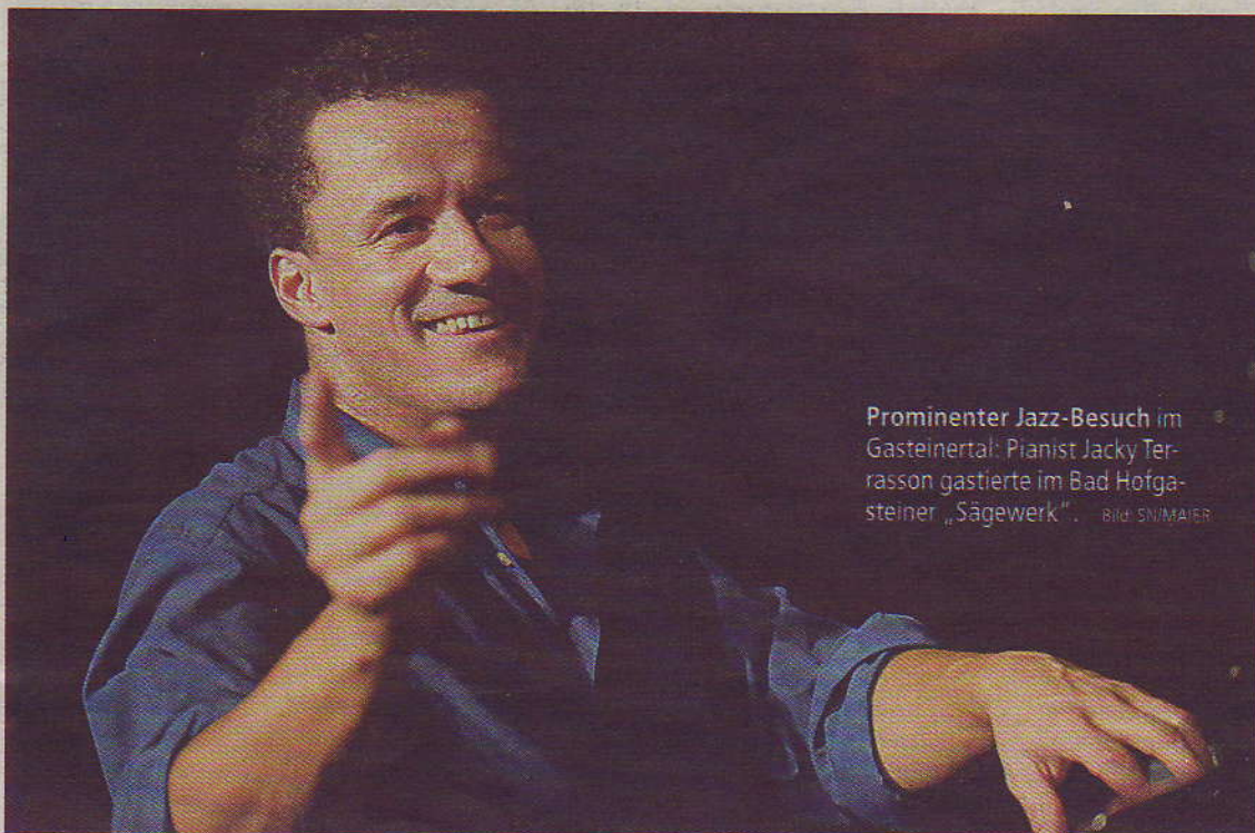
Prominenter Jazz-Besuch im Gasteinertal: Pianist Jacky Terrasson gastierte im Bad Hofgasteiner „Sägewerk“.

Auch Terrasson musste am Ende des bejubelten Sets ins Klavier greifen und sein dort abgelegtes Handy herausfischen – die Reihenfolge hatte er sich als SMS-Notiz gespeichert.